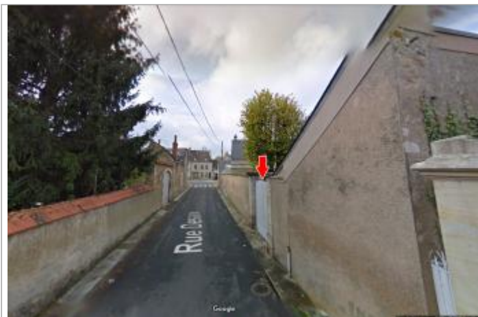
Vue du site en 2010