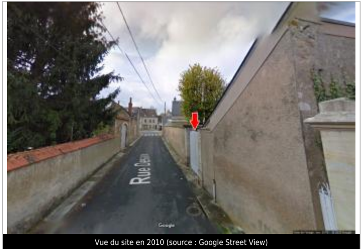
Vue du site en 2010

Coordonnées WGS84 : X: 2.50576510 / Y: 46.71939800