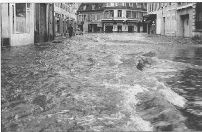
Photo d'archive de la crue extraite du livre "Deux siècles de calamité en Berry"