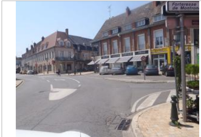
Vue du site en 2014

Coordonnées WGS84 : X: 2.50421330 / Y: 46.72157900