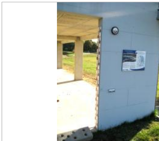
Échelle et repères EP Loire en 2014

Coordonnées WGS84 : X: 2.18046500 / Y: 47.09670000