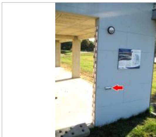
Vue du repère en 2014