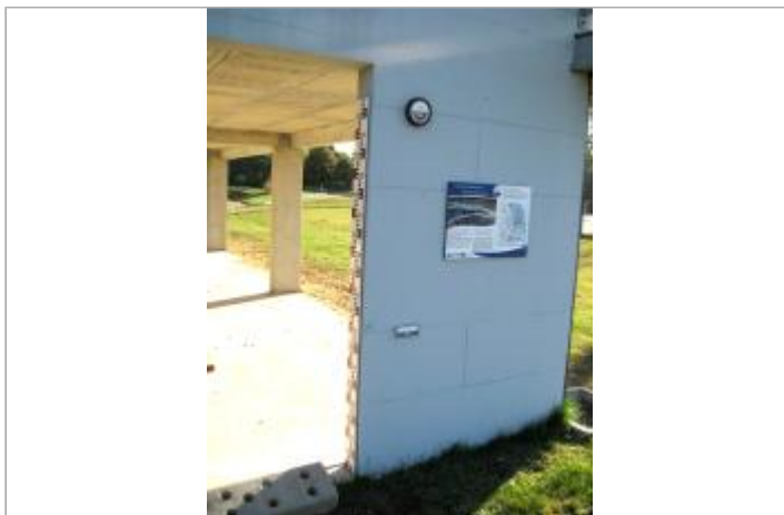
Échelle et repères EP Loire en 2014