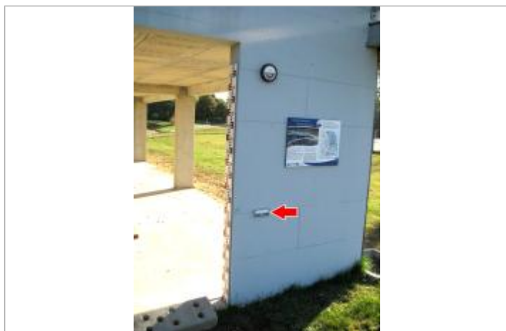
Vue du repère en 2014