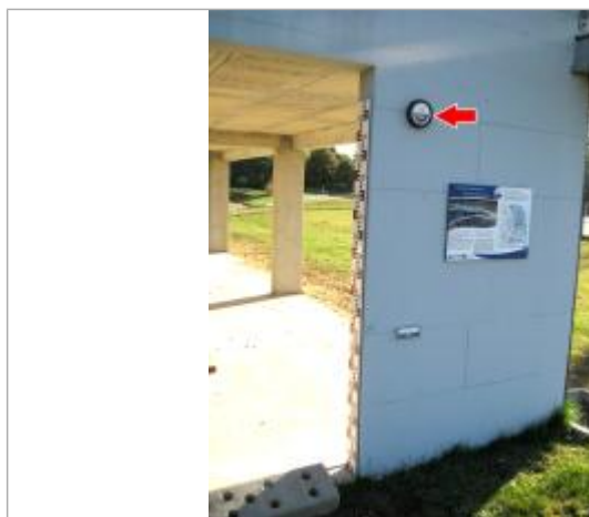
Vue du repère en 2014