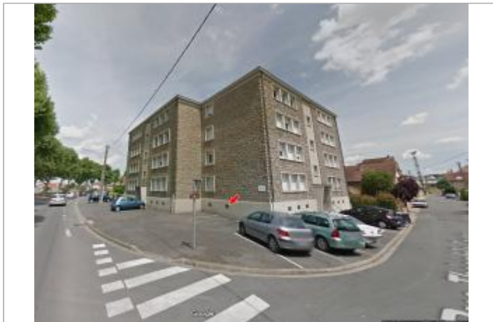
Vue du site en 2012