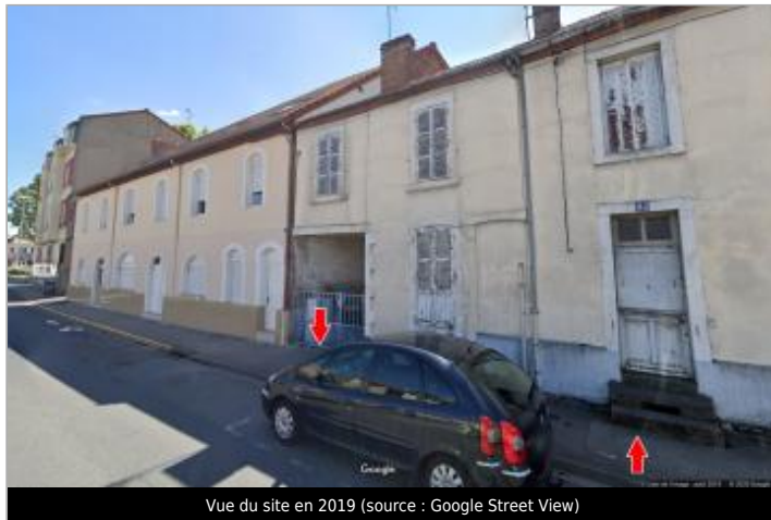
Vue du site en 2019