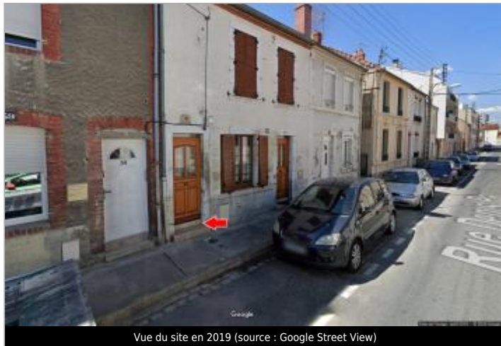
Vue du site en 2019

Coordonnées WGS84 : X: 2.59588000 / Y: 46.34469300