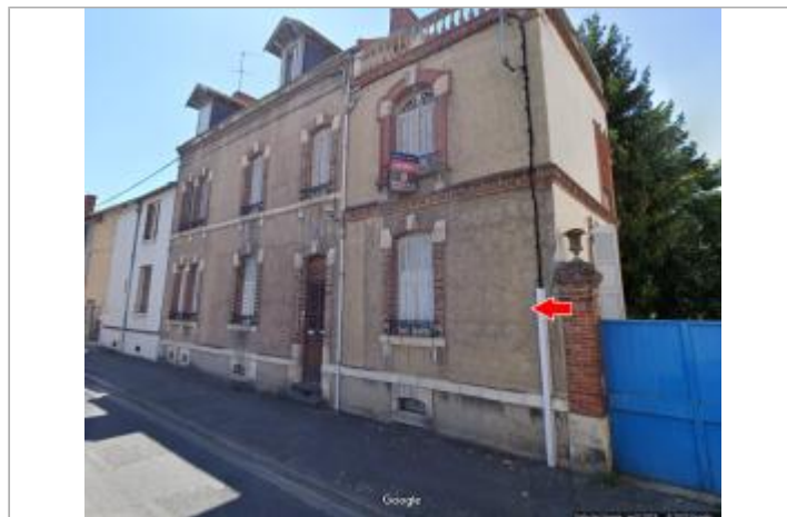
Vue du site en 2019

GÉOLOCALISATION Coordonnées WGS84 : X: 2.59305280 / Y: 46.33845100 Coordonnées RGF93 (Lambert 93) X: 668699 / Y: 6582139.96 Coordonnées RGF93 (ETRS89) : X: 2.5930528 / Y: 46.338451 Code Hydro: K---0090 Rive de référence: Droite