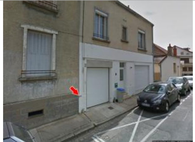
Vue du site en 2016