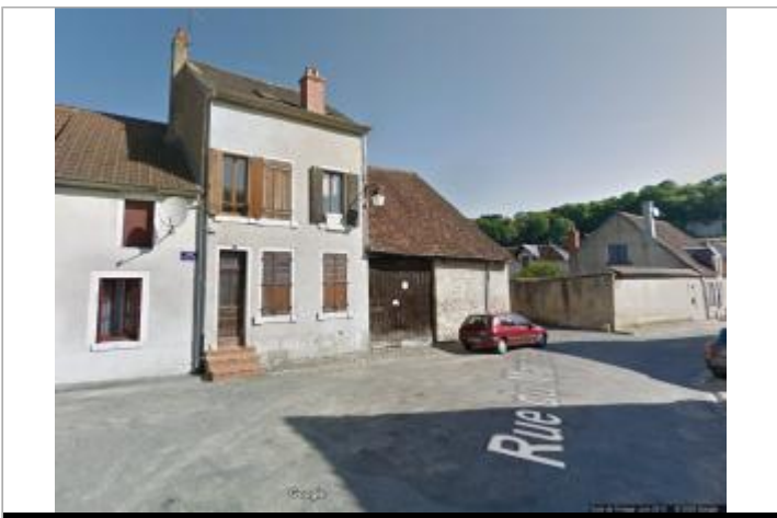
Vue du site en 2013

GÉOLOCALISATION Coordonnées WGS84 : X: 2.31735270 / Y: 46.85766500 Coordonnées RGF93 (Lambert 93) X: 647992 / Y: 6639946.98 Coordonnées RGF93 (ETRS89) : X: 2.3173527 / Y: 46.857665 Code Hydro: K---0090 Rive de référence: Droite