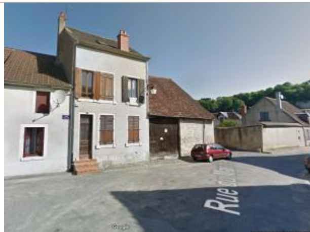
Vue du site en 2013 (source : Google Street View)