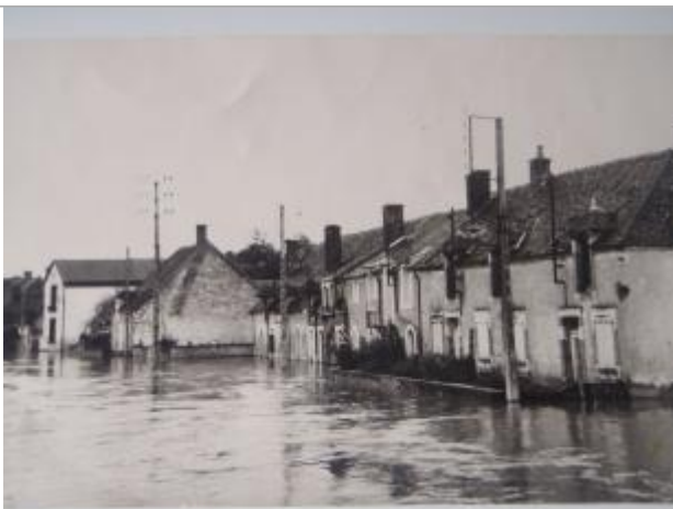
Photographie d'archive de 1960

Altitude calculée de l'eau (en m) : 137.83