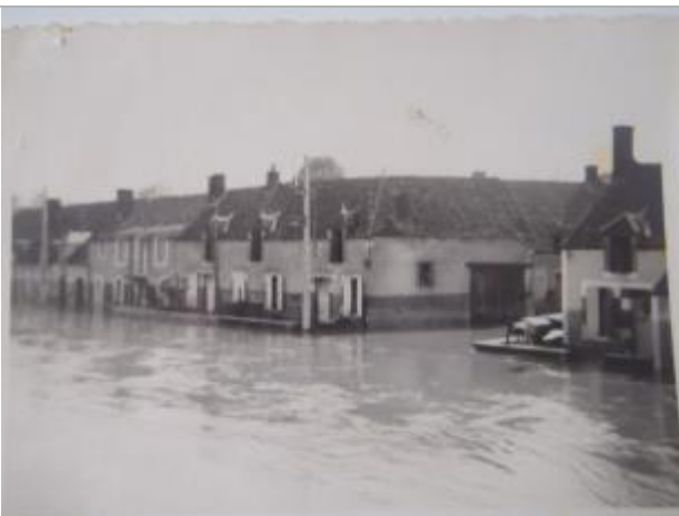
Photographie d'archive de 1940

Altitude calculée de l'eau (en m) : 138.8