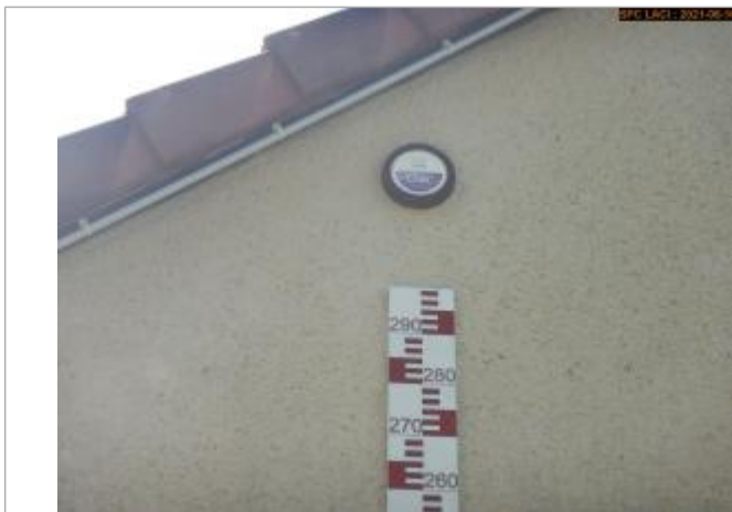
Vue du repère en 2021