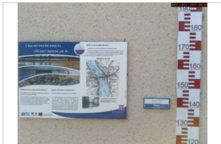
Vue du repère en 2021