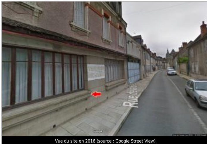
Vue du site en 2016

Coordonnées WGS84 : X: 2.42305030 / Y: 46.19034200