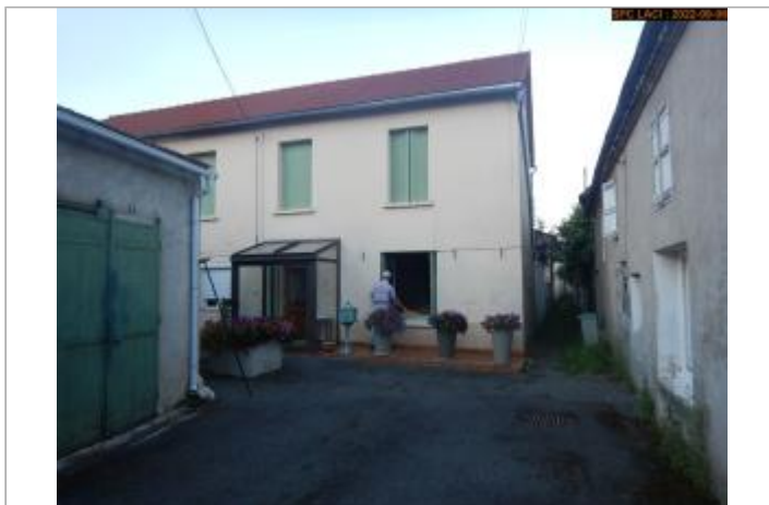
Vue du site éloignée (à partir de l'impasse)