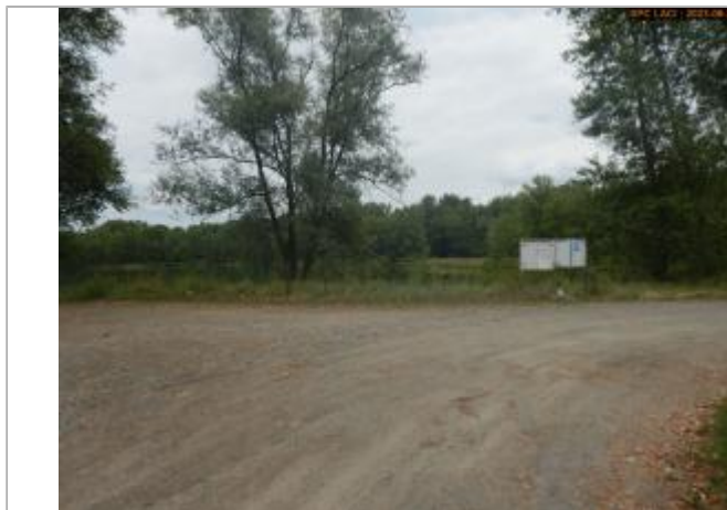
Vue du site en 2023 (sans le panneau)