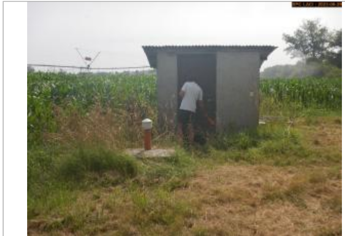
Vue du site en 2023

Coordonnées WGS84 : X: 3.39432420 / Y: 46.26649290