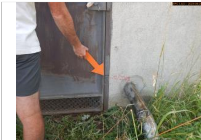
Vue du repère en 2023