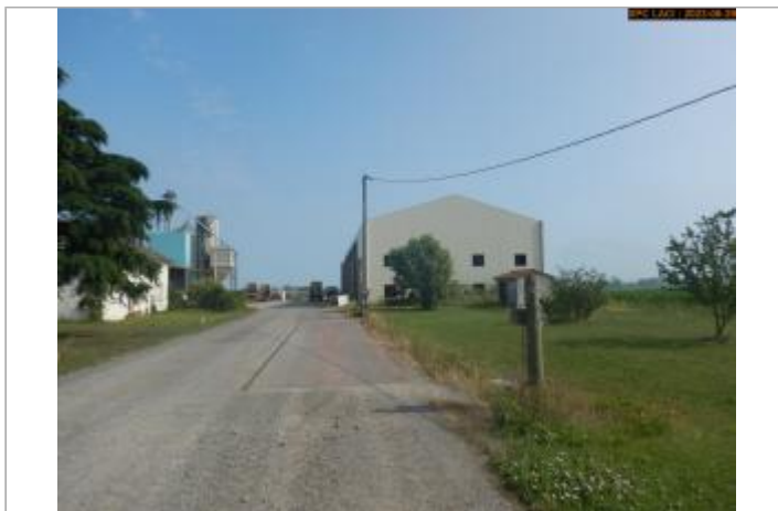
Vue du site en 2023 (avec le nouveau bâtiment)