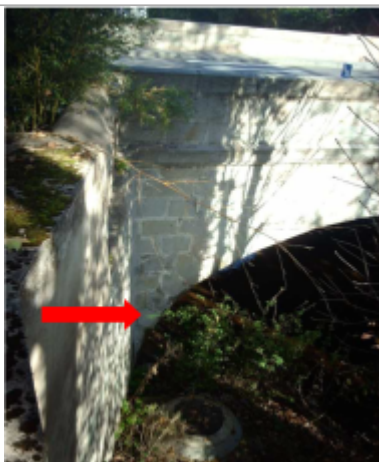
Vue du repère en 2009