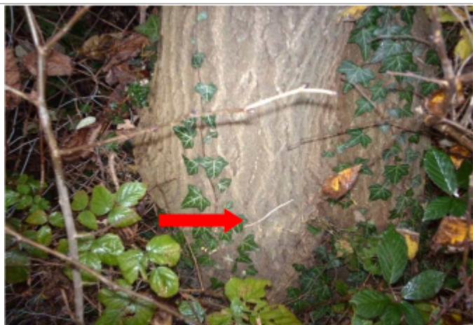
Vue du repère en 2009

Altitude calculée de l'eau (en m) : 373.629