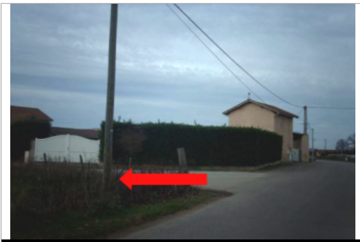
Photo du site et du repère de la crue de 2008

GÉOLOCALISATION Coordonnées WGS84 : X: 4.29193300 / Y: 45.64501740 Coordonnées RGF93 (Lambert 93) X: 800627 / Y: 6505876 Coordonnées RGF93 (ETRS89) : X: 4.291933 / Y: 45.6450174 Code Hydro: K0684200 Rive de référence: Non renseigné