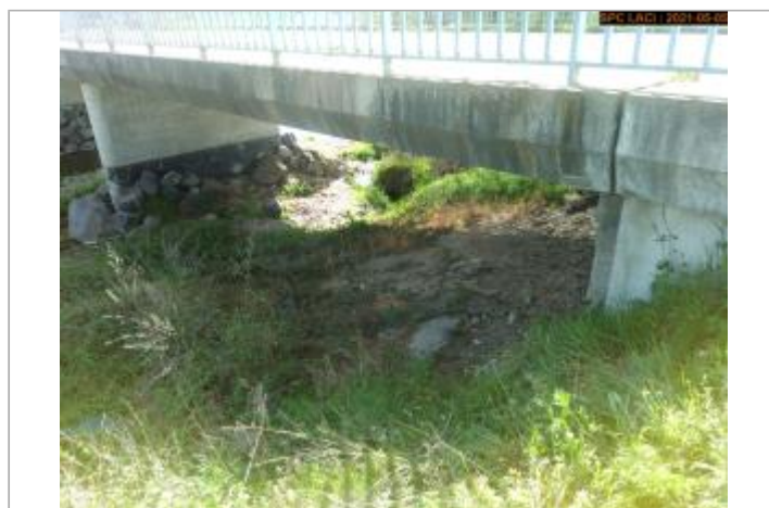
Vue du panneau d'information en 2021

GÉOLOCALISATION Coordonnées WGS84 : X: 3.93321780 / Y: 45.12514900 Coordonnées RGF93 (Lambert 93) X: 773371 / Y: 6447751.98 Coordonnées RGF93 (ETRS89) : X: 3.9332178 / Y: 45.125149 Code Hydro: K0306400 Rive de référence: Droite