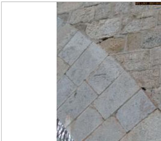
Vue du repère en 2021