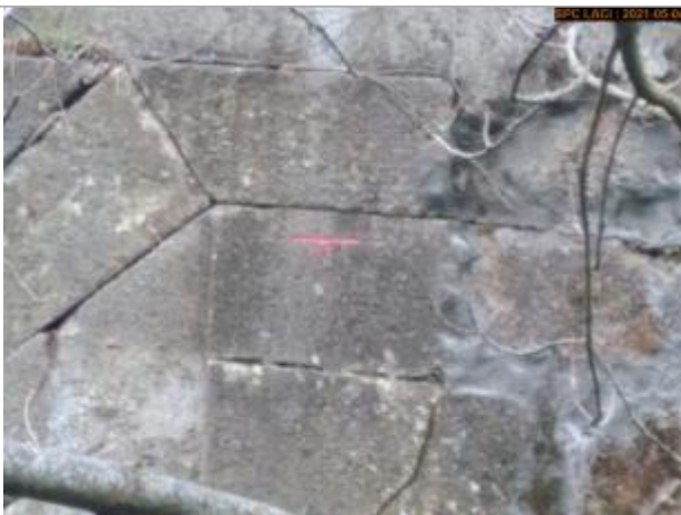
Vue du repère rapprochée en 2021

Différence entre le niveau d'eau et la référence (en m) : 0.670 m