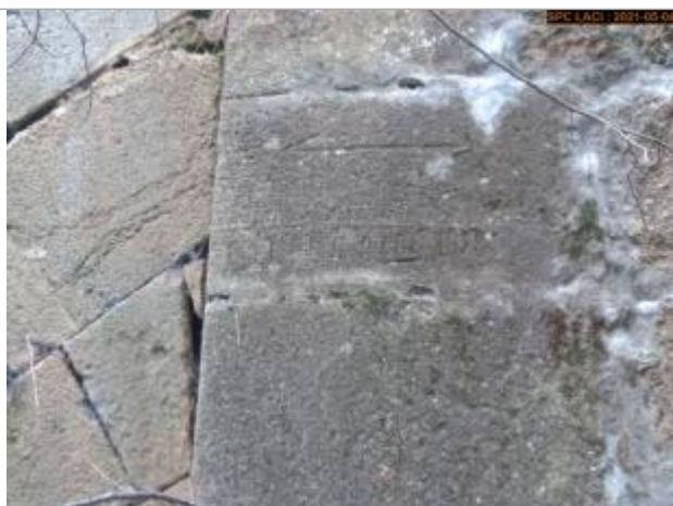
Vue du repère rapprochée en 2021