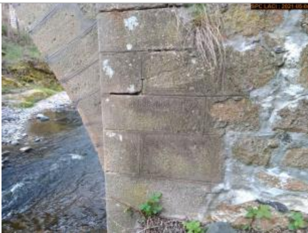
Vue du repère rapprochée en 2021

Différence entre le niveau d'eau et la référence (en m) : 3.920 m