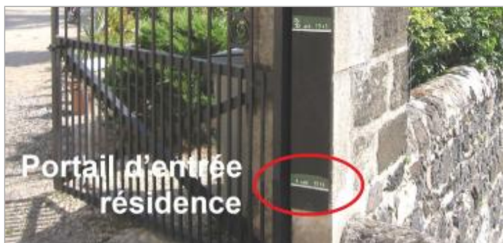
Vue du repère rapprochée en 2008

SOURCE DE REPÉRAGE : ETUDE CIDEE POUR LE SICALA DE HAUTE-LOIRE - AVRIL 2007 -