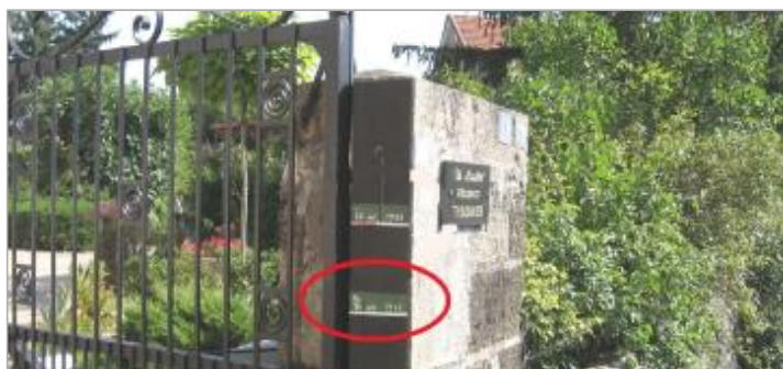
Vue du repère rapprochée en 2008