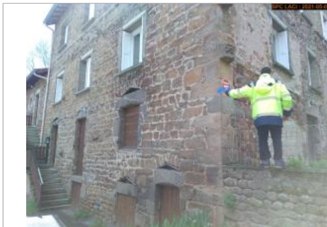
Vue du site rapprochée en 2021