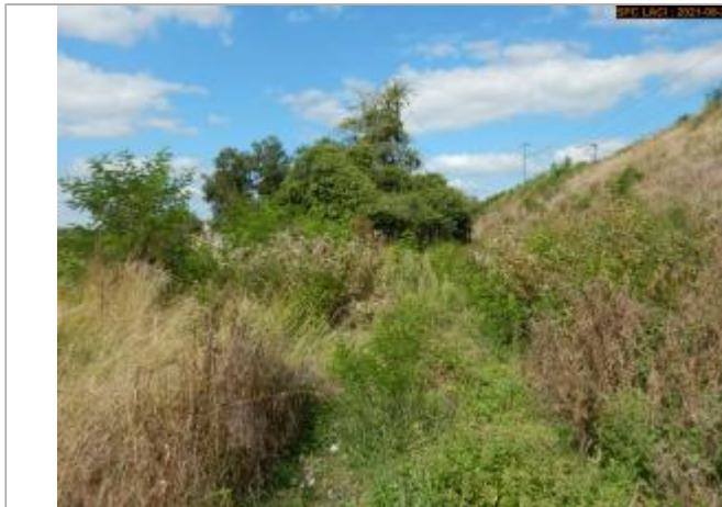
Vue du chemin vers le site en 2021