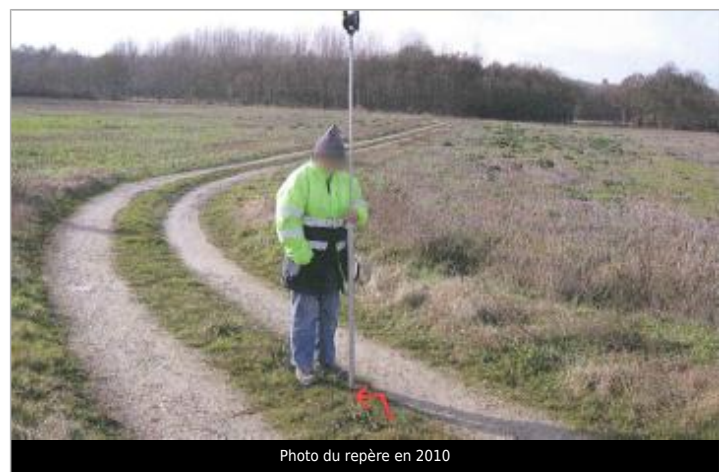
Photo du repère en 2010

GÉNÉRAL Code : LCI_R_2484_3751 Date de mise à jour : 05/08/2021 Auteur : SPC LCI