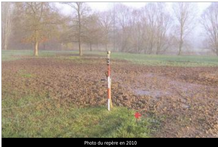
Photo du repère en 2010