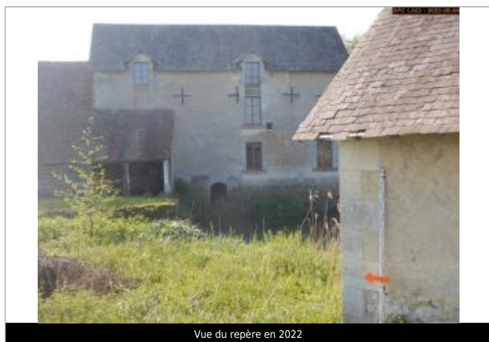
Vue du repère en 2022