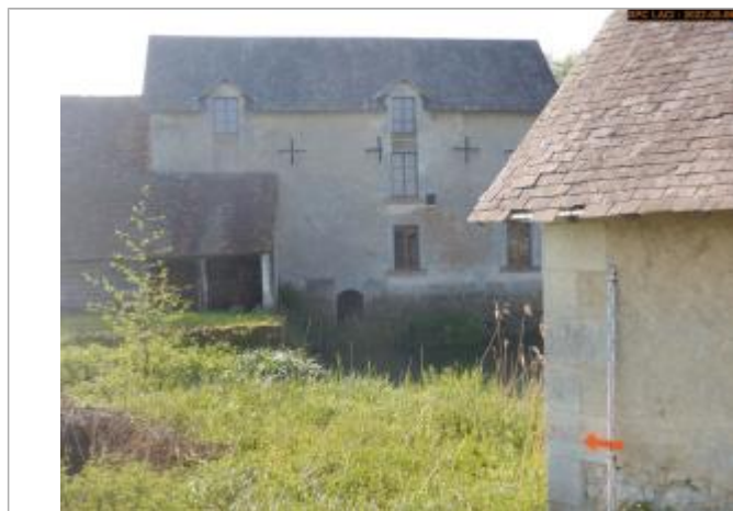
Vue du repère en 2022

Altitude calculée de l'eau (en m) : 82.98