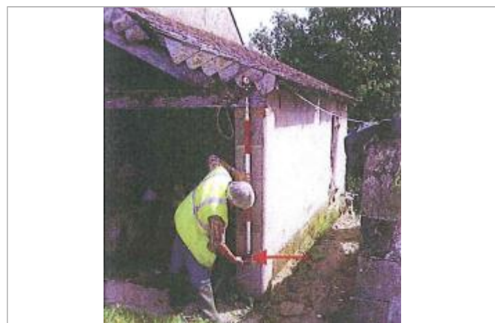
Photo du repère

GÉNÉRAL Code : LCI_R_2441_3706 Date de mise à jour : 04/08/2021 Auteur : SPC LCI