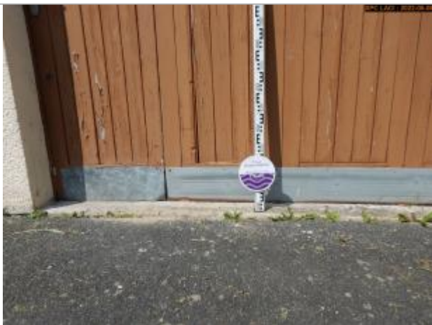
Vue du repère en 2022

Altitude calculée de l'eau (en m) : 98.53