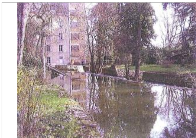
Vue de la crue