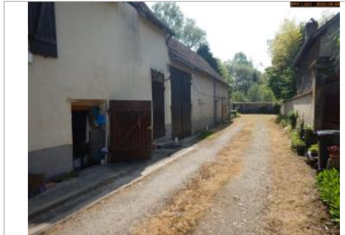
Vue du site en 2022

Coordonnées WGS84 : X: 1.17795520 / Y: 46.98771500