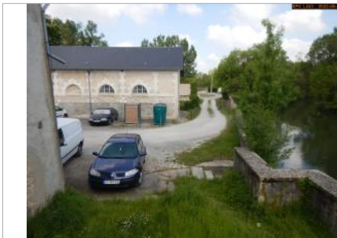
Vue du site en 2022

Coordonnées WGS84 : X: 1.17955330 / Y: 46.98910900