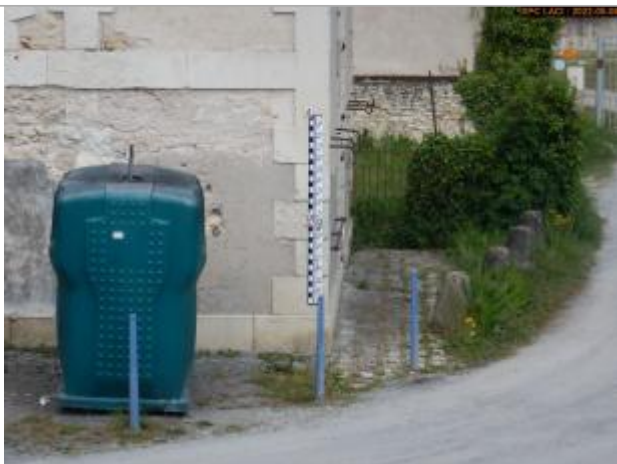
Vue du repère rapprochée en 2022

Altitude calculée de l'eau (en m) : 87.16