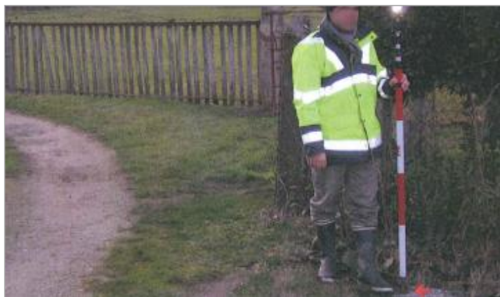
Photo du repère en 2010