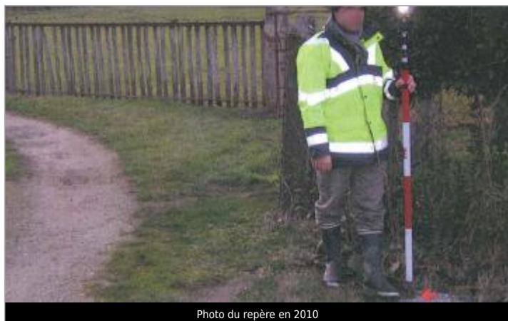
Photo du repère en 2010