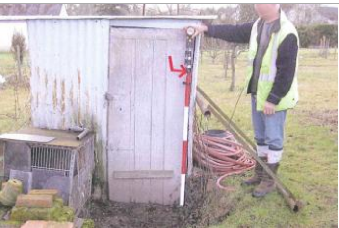
Vue du repère en 2010