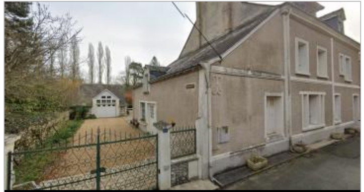
Vue du site en 2023 (Google Maps)

Coordonnées WGS84 : X: 0.83511630 / Y: 47.27082534