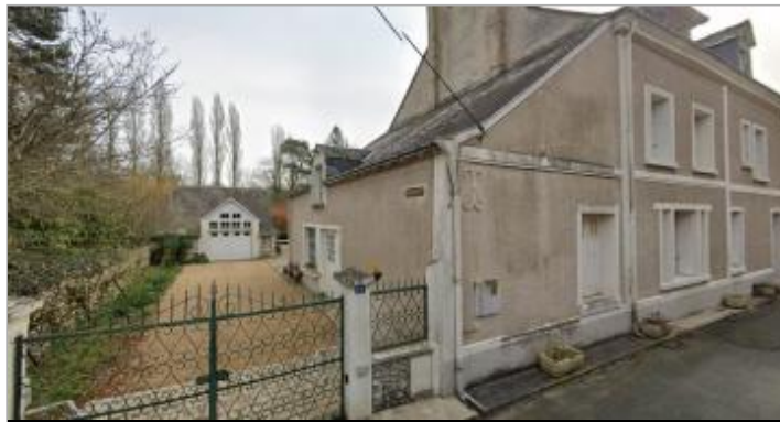
Vue du site en 2023

Coordonnées WGS84 : X: 0.83511630 / Y: 47.27082534