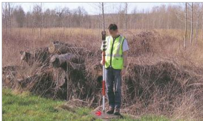
Vue du repère en 2010