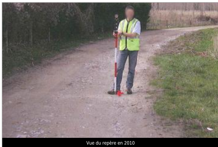
Vue du repère en 2010