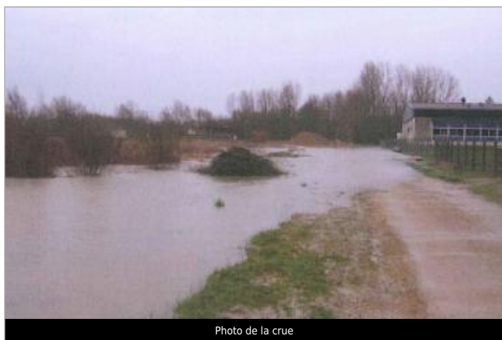
Photo de la crue