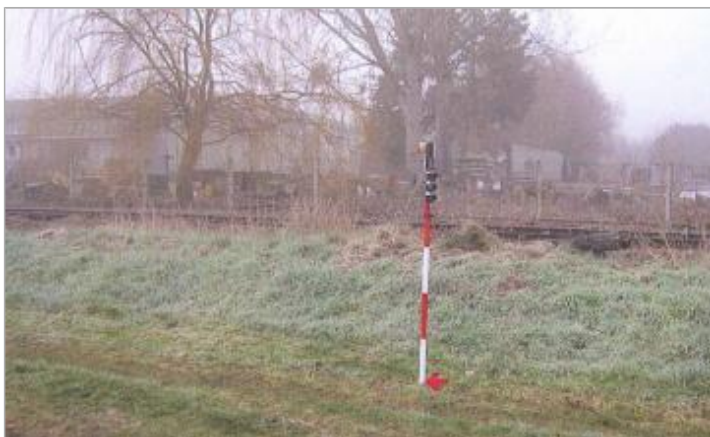
Photo du repère en 2010