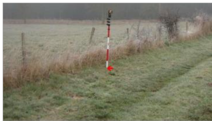
Photo du repère en 2010