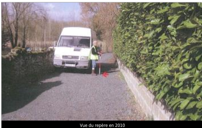
Vue du repère en 2010