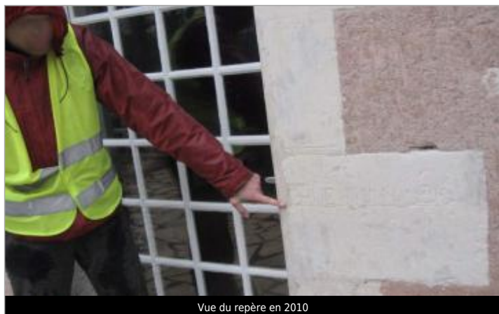
Vue du repère en 2010