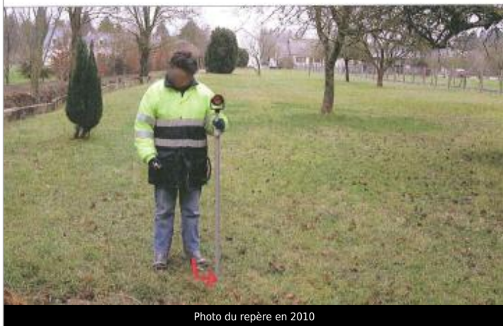
Photo du repère en 2010