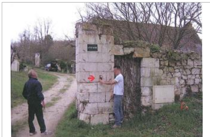
Vue du repère en 2010