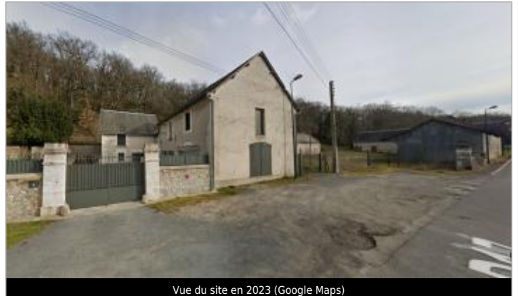
Vue du site en 2023 (Google Maps)

Coordonnées WGS84 : X: 0.79459670 / Y: 47.28082190