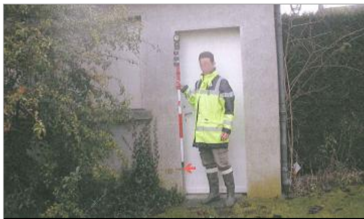
Vue du repère en 2010