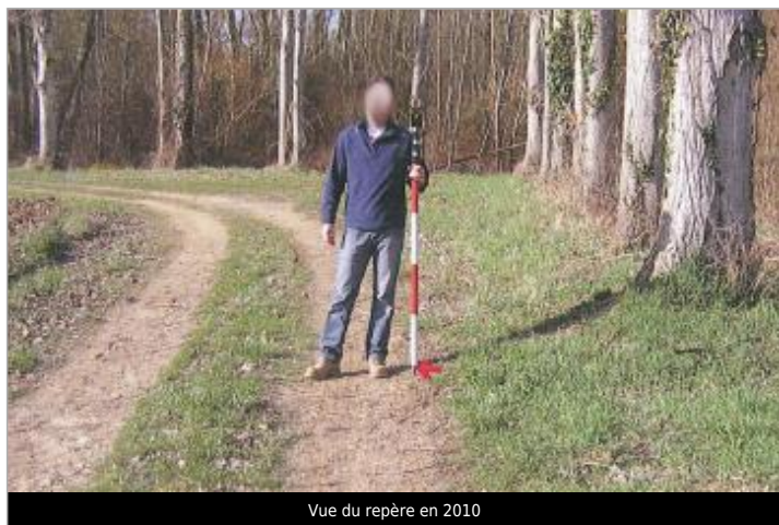
Vue du repère en 2010