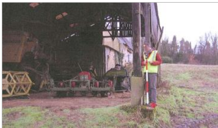
Photo du repère en 2010