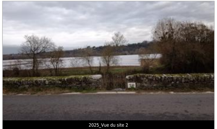
2025_Vue du site 2

Coordonnées WGS84 : X: -1.37144278 / Y: 47.28983030