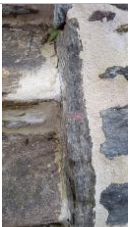
2025_Résidu du peinture pour 1995 ?

Altitude calculée de l'eau (en m) : 7.507